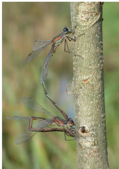
La femelle du Leste vert insère ses œufs sous l'écorce de branchettes

insèrent leurs œufs dans des tissus végétaux situés nettement au-dessus de l'eau. La femelle du Leste vert Lestes viridis parvient même