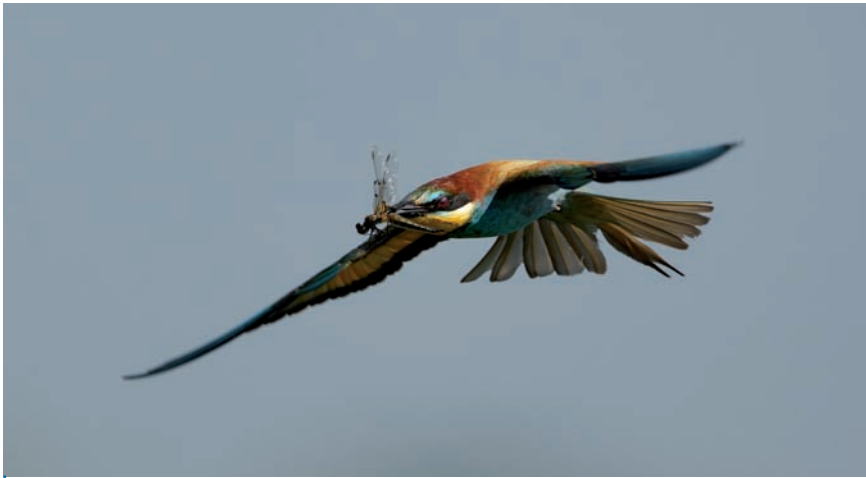
Prédation en vol par un Guépier d'Europe