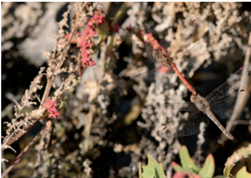
Couple de Sympetrum striatum lors de la ponte. Le tandem vole en oscillant. La femelle lâche quelques œufs à chacune des impulsions provoquées par le mâle

lata cependant, la femelle dépose en une fois une grappe d'œufs qui formera une sorte de ruban gélatineux, assez semblable à la ponte d'un crapaud. Cette ligne d'œufs s'ancre à la végétation.