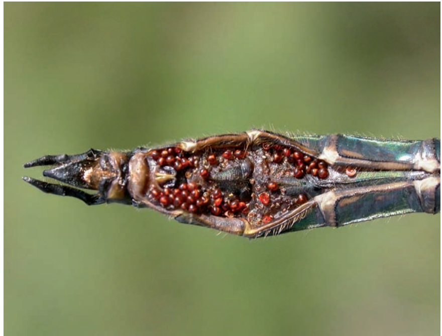
Cette Cordulie métallique Somatochlora metallica à la pointe de l'abdomen infestée d'hydracariens

handicap. Dans le pire, ils ne pourront pas décoller. Il arrive que le froid empêche les libellules de terminer leur émergence. Les insectes, à bout de force, restent alors prisonniers de l'exuvie où leur cuticule et leurs ailes se solidifient.