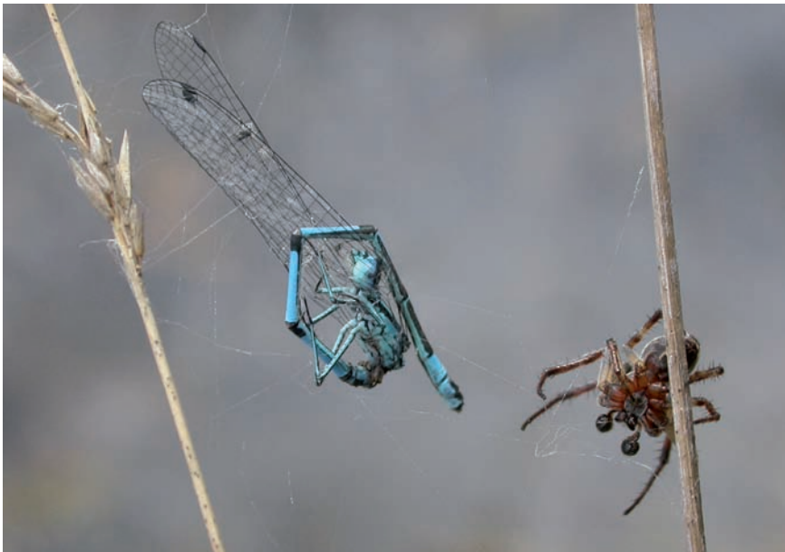
Cette araignée a capturé un Agrion jouvencelle

parasitoïdes, soit des parasitoïdes de parasitoïdes.