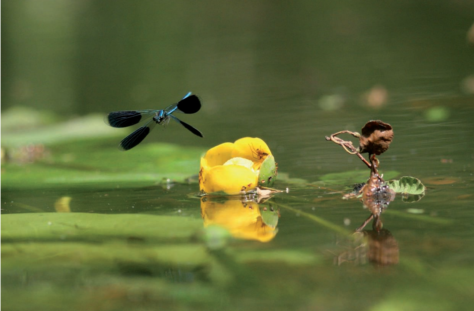
Ce mâle de Caloptéryx éclatant Calopteryx splendens gardienne sa femelle, en ponte sous la surface de l'eau