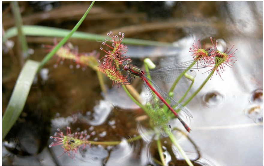
Cette Nympha au corps de feu s'est engluée dans les feuilles d'une plante carnivore, un rossolis Drosera intermedia

La capture d'odonates par des plantes est un phénomène peu commun mais bien documenté. En Europe, les cas les plus fréquents concernent des plantes carnivores du genre Drosera , qualifiés en français