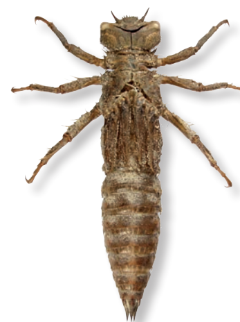
Exuvie de cordulégastre bidenté (G. DOUCET, 2011)

suintements et autres microhabitats, souvent dans des contextes forestiers. Les larves sont souvent emportées par le courant, et les imagos sont alors retrouvés dans des milieux différents du site de ponte (eaux stagnantes ou grands cours d'eau). Ces milieux peuvent être asséchés pendant l'été. Les paysages boisés de feuillus et clairs conviennent à l'espèce, qui recherche en particulier les lisières, les clairières et les chemins forestiers. Les éléments ligneux servent de lieu de repos et d'accouplement. L'espèce peut être observée jusqu'à 1 400 mètres d'altitude.