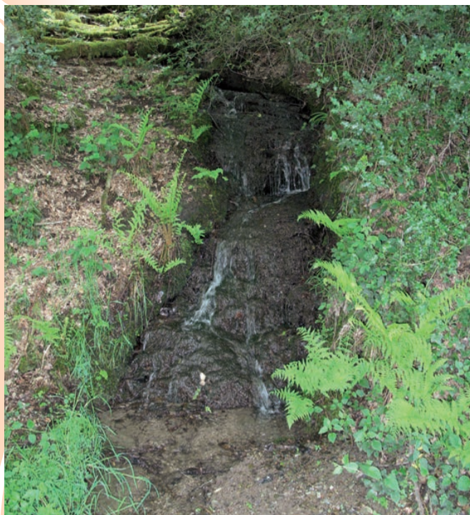
Source ombragée en milieu forestier, biotope favorable au cordulégastre bidenté

Le cordulégastre bidenté fréquente les eaux courantes de faible importance et ombragées, sur substrats minéraux et meubles. Les effluents de sources et les sources tufeuses incrustantes sont particulièrement favorables. Il occupe des ruisselets, résurgences,