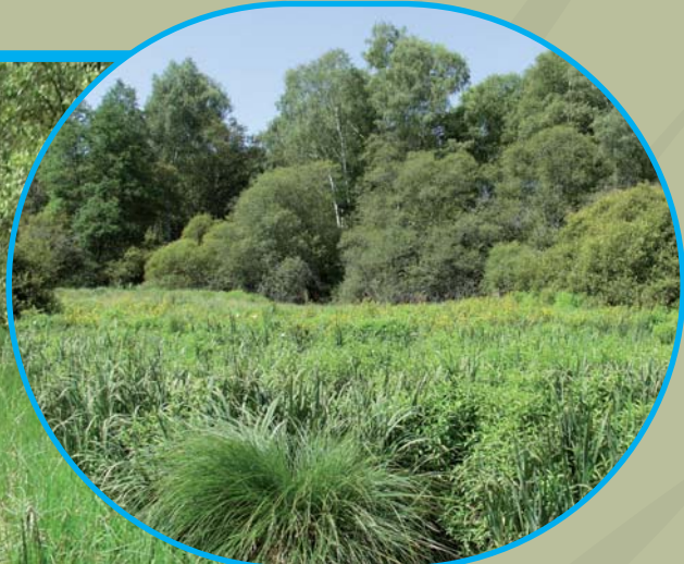
Marais du Brezou Lagraulière, 19