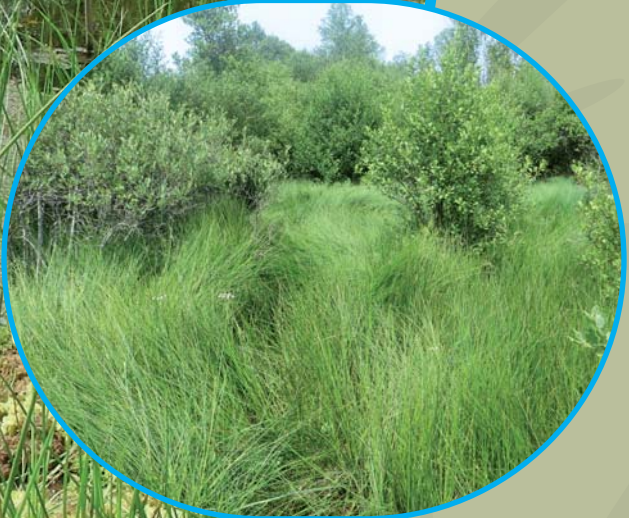
Camp militaire de la Courtine La Courtine, 23