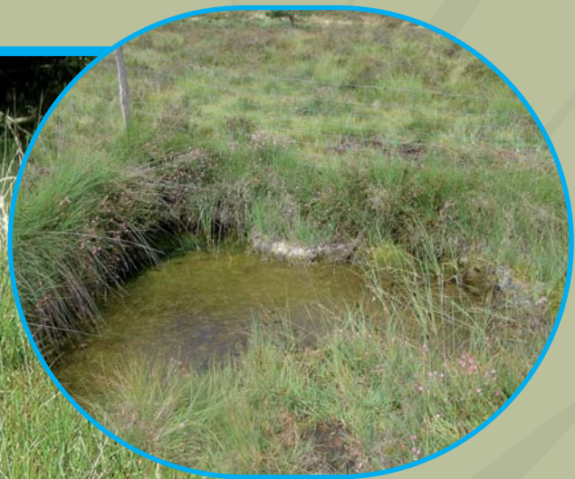
Tourbière et landes d'Ars et du Pont Tord PérOLS-sur-Vézère, 19