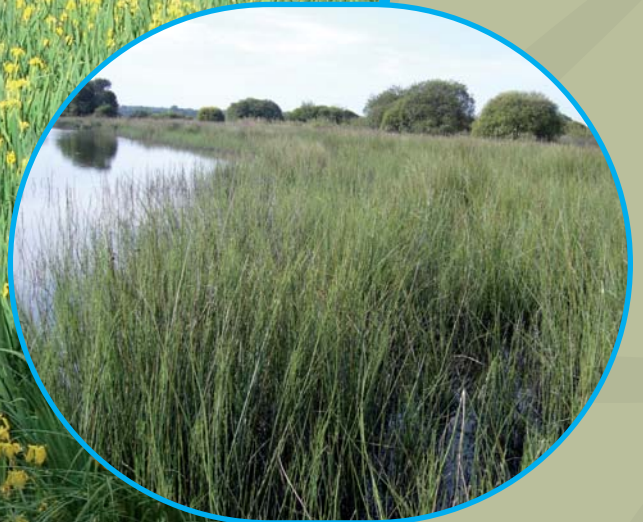
Etang des Landes, ceinture de Prêles Lussat, 23