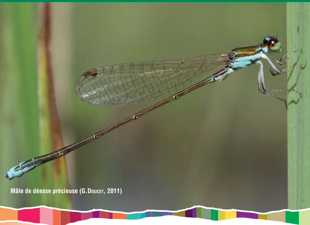
Mâle de déesse précieuse (G. DOUCET, 2011)