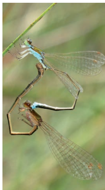
Cœur copulatoire de déesses précieuses (G. DOUCET, 2011)

L'accouplement dure en général deux heures et s'effectue à quelques mètres du lieu de ponte. La femelle pond dans les tiges et les feuilles de laïches en décomposition, le plus souvent seule mais parfois en tandem. La majorité des larves effectuent leur cycle de développement en un an ; 10 à 20 % d'entre elles le font en deux ans. Leur maturation a une durée d'une à deux semaines. Enfin, la déesse précieuse est rarement rencontrée au-delà de 900 mètres d'altitude.