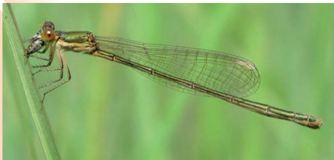
Femelle de déesse précieuse (G. DOUCET, 2011)

La déesse précieuse est caractérisée par sa petite taille (abdomen compris entre 19 et 23 mm, 11 à 16 pour les ailes postérieures) et son vol faible qui en font l'odonate le plus fragile d'Europe. La partie supérieure de l'abdomen des mâles et des femelles est de couleur vert métallique, avec pour les mâles une extrémité bleu-gris, couleur également de la partie inférieure du thorax et des fémurs. De plus, un trait bleu étroit est visible sur la face dorsale de la tête. Bien que les risques de confusion soient faibles en raison de sa petitesse, les femelles âgées peuvent être confondues avec celles de l'agrion nain ( Ischnura pumilio ).