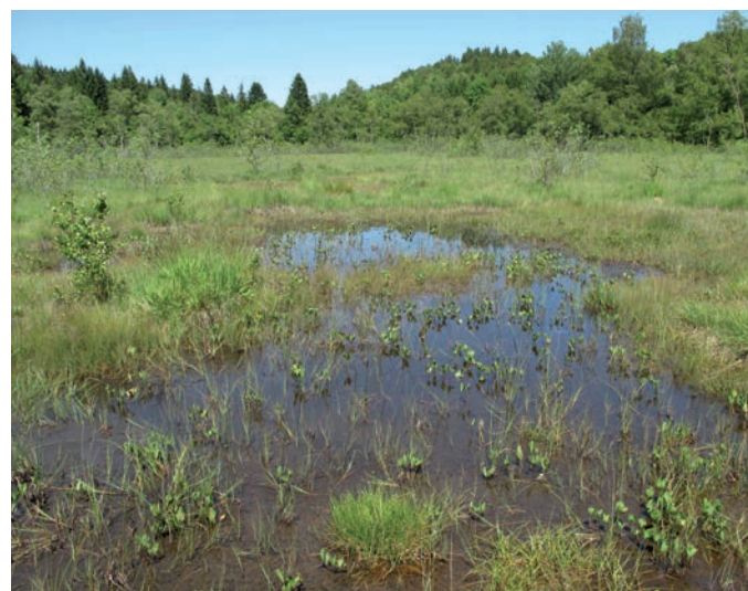
Site de reproduction de la déesse précieuse en Franche-Comté (G. DOUCET, 2011)

Les adultes se rencontrent de juin à début août. Ils volent peu, bas et lentement, et se cachent dans la végétation, ce qui rend leur détection difficile. Ils se posent longuement sur les plantes les plus fines, notamment la laïche des tourbières ( Carex limosa ) et la laïche filiforme ( Carex lasiocarpa ).