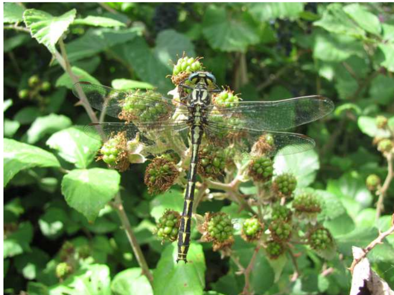
Figure 1. Mâle de Gomphus graslinii Rambur, 1842, observé le 29 juin 2012 au bord du Canal de la Vallée des Baux, près du château de Barbegal.

Les 28 et 29 juin 2012, nous sommes retournés toujours sur la rive nord du canal, entre Barbegal et la route D570n (seule rive publiquement accessible dans cette portion), respectivement en fin d'après-midi vers 17 h et le matin vers 10 h, afin de poursuivre nos prospections. Nous avons eu la satisfaction de pouvoir y observer deux mâles distincts de G. graslinii , à savoir un à chaque sortie, vers 19 h le 28 et vers 11 h le 29 (Fig 1 et 2). Ces observations ont eu lieu cette fois-ci à proximité de Barbegal, dont une fois à l'est de la route D 33, et non plus près de l'Étang de la Gravière (Fig. 3). Le ♂ du 28 juin était posé sur le chemin longeant le canal et, à notre approche, s'envolait pour se reposer un peu plus loin sur le même chemin, comportement fréquent des gomphes adultes. Celui du 29 juin se tenait plus à l'ombre dans la végétation. Sur les photographies prises, l'aspect de la tache dorsale jaune en forme de « verre à pied » du S8, ainsi que celui de la tache dorso-médiane du S9, entre autres, attestent qu'il s'agissait bien de deux mâles distincts (Fig. 2, a & b).