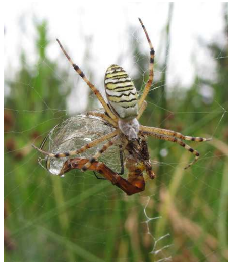
Figure 5. Femelle d' Argiope bruennichi dévorant un imago de S. depressiusculum.

A trois reprises, au sein des bassins concernés, nous avons observé des ♀ de l'araignée Argiope bruennichi (Scopoli, 1772) en train de dévorer un imago de S. depressiusculum prisonnier dans leur toile (Fig. 5). Les mêmes observations ont pu être faites quatre fois sur I. elegans parmi les Zygoptères, et une fois sur d'autres espèces d'Anisoptères : S. fonscolombii , C. erythraea et O. cancellatum . Ces araignées étaient nombreuses sur certains bassins, en particulier sur les bassins ORI 49.45 et 49.53 (une trentaine d'individus relevés sur chacun), leur piège orbiculaire généralement tissé dans les hélophytes, entre 20 et 50 cm au-dessus de l'eau.