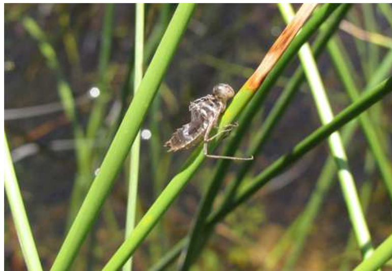
Figure 2. Exuvie de S. depressiusculum trouvée dans le bassin ORI 50.25.