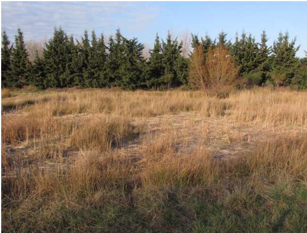
Figure 4. Vue d'une partie du bassin ORI 49.53 (12/01/2012).

Notons que quatre des espèces ci-dessus sont formellement autochtones dans les bassins fréquentés par S. depressiusculum (découverte d'exuvie(s), cf. tableau 3). Il s'agit de S. fonscolombii , C. erythraea , O. cancellatum et A. imperator . Deux autres, I. elegans et A. parthenope , ont montré des comportements suggérant leur autochtonie (tandems et pontes dans des habitats aquatiques favorables (Tab. 3)).