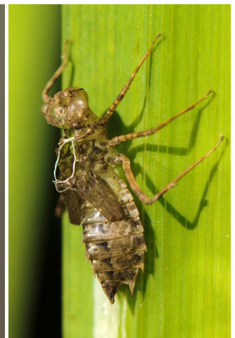
Figure 3. Exuvie de Leucorrhinia caudalis , Bossay-sur-Claise, 1 er juin 2012.