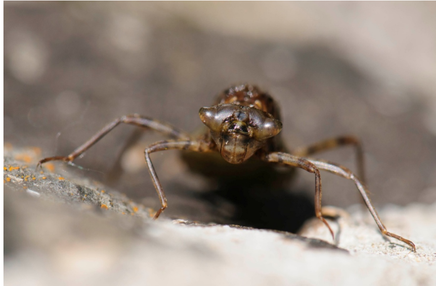
Figure 1. Larve de Leucorrhinia caudalis en déplacement terrestre, Mazières-de-Touraine, 13 mai 2011 (© É. Sansault).