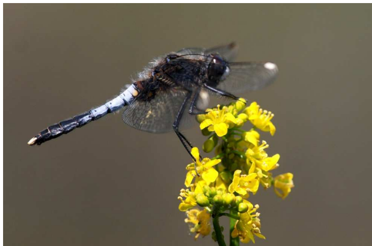
Figure 2. Leucorrhinia caudalis ♂ territorialisé, Ambillou, 20 mai 2012.